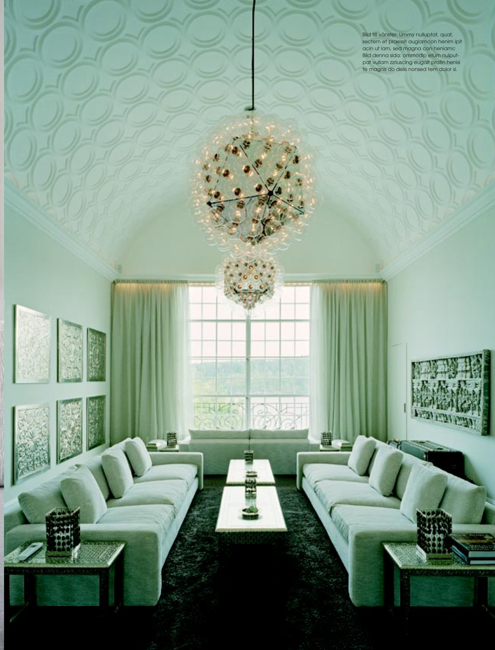
Bild till vänster: Ummý nulluþót, quat, sectem et praesit auglamcon henim ipit acin ut lam, sed magna con heniamc Bild denna sida: ommodip etum nulput-pat vullam zziuscing eugait pratin henisi te magnis do delis nonsed tem dolor si.